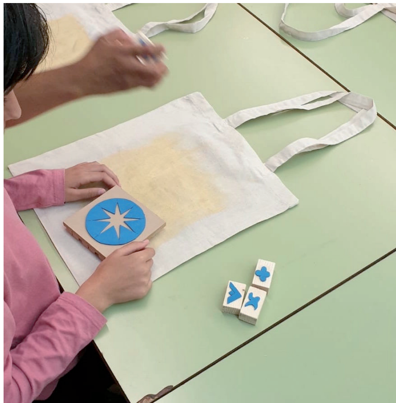
Procès de treball

Exemples d'obres del Museu de les que s'han extret els detalls decoratius.