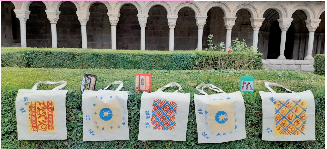
Fotogrames del Reel per Instagram